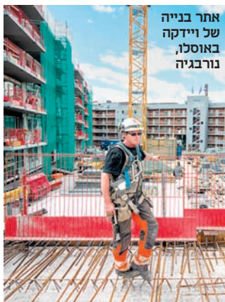
אתר בנייה של ויידקה באוסלו, נורבגיה

ההכנסות והרווח הנקי של חברת הבנייה, במיליארדי דולרים