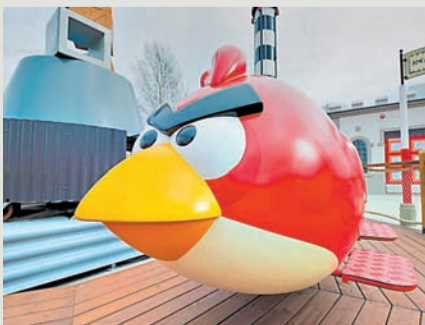
מוזיאון אנגרי בירס בפינלנד

בפינלנד פורחת בשנים האחרונות תעשיית ההייטק וכן תעשיית הסטארט-אפים. כך, לדוגמה, ממציאת משחק אנגרי בירס היא החברה הפינית Rovio.