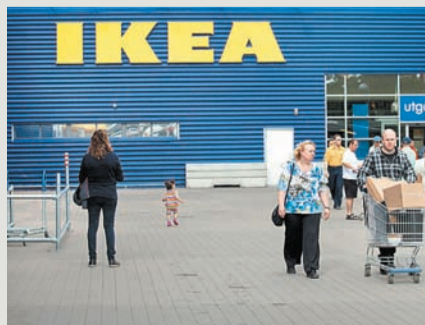
סניף איקאה בשבדיה

היצוא נחשב לחלק משמעותי ביותר בפעילות הכלכלה השבדית, ושוקי היעד המרכזיים שלה הם שאר מדינות סקנדינביה, גרמניה, בריטניה, ארה"ב ואסיה. בתחילת שנות התשעים, בעקבות משבר כלכלי שפקד את המדינה, ביצעה ממשלת שבדיה הורדת מסים וקיצוץ במדיניות הרווחה והחלה בתהליך הפרטה שנמשך גם בשנות האלפיים. אף על פי כן, שבדיה עדיין מאופיינת במדיניות רווחה נרחבת, מסים גבוהים וארגוני עובדים חזקים. הכלכלה המקומית אמנם נפגעה במשבר הפיננסי שאירע ב-2007-2008, אולם השכילה להתאושש ממנו במהירות, תוך נקיטת מדיניות של שמרנות תקציבית נוקשה.