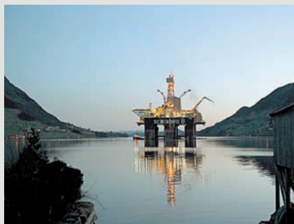
אסדת קידוח בנורבגיה

בשל התלות החזקה של המדינה במחירי הנפט, הקימה ממשלת נורבגיה קרן השקעות ממשלתית מיוחדת שתהווה כרית ביטחון לצמצום התלות ותספק ביטחון פנסיוני לאזרחי המדינה. מהלך זה נתפס באופן חיובי בעולם, וה-CDS שלה נמצאים ברמות מחיר נמוכות מאוד גם בתקופות משבר. עם זאת, לנוכח תלות זו, עד לשנים האחרונות לא התפתחה בנורבגיה תעשייה מפותחת, והיא מייבאת את מרבית המוצרים התעשייתיים הדרושים לה.